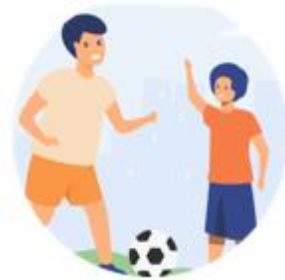
Спорт и здоровье